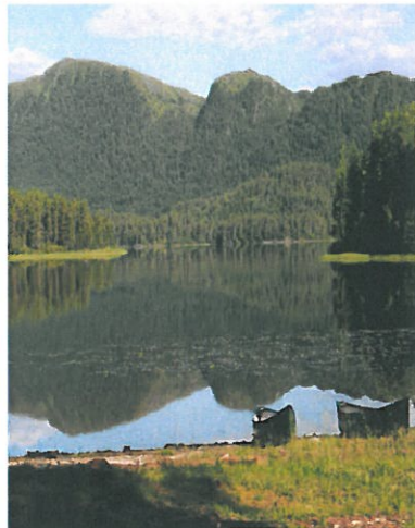
Fra en av våre friluftaktiviteter på avklaringstiltaket, kanotur på Sengsdalsvatnet.