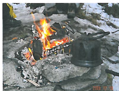
Og kaffelars er alltid med på tur

EQUASS er et europeisk system for kvalitetssikring av velferdstjenester med ekstern revisjon og sertifisering. Det gir tjenesteleverandører i velferdssektoren anledning til å sikre kvaliteten av tjenestene overfor brukere og andre samarbeidspartnere.