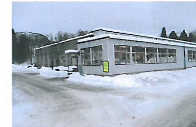
Vår nye fasade med butikken i front.

Gava og Tølo er flyttet ut fra Øragata og inn i lyse og romsligere lokaler i nybygget. Inngang på framsida av bygget når du svinger inn på området.