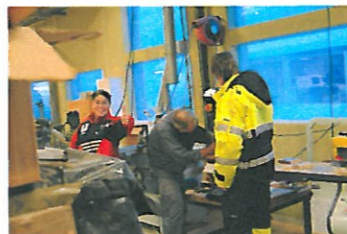
Verkstedet fungerer både som utprøvnings- og arbeidsplass

NAV vil ikke fra 2012 kjøpe tjenester fra de bedriftene som ikke har et kvalitetssikringssystem. EQUASS er det best egnede system som ivaretar krav NAV stiller til tiltaksarrangørene. NHO valgte EQUASS som et bedre sertifiseringssystem enn ISO.